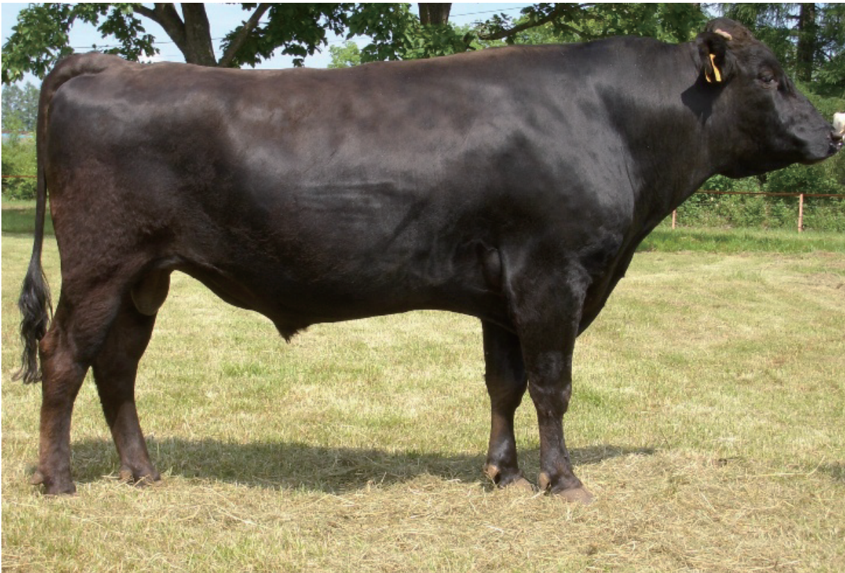
和牛 黒毛和種（オス）

「松阪牛」はメスの未経産（子牛を産んでいない母牛）で全等級が対象とされ、流通ルートも厳格に定められています。