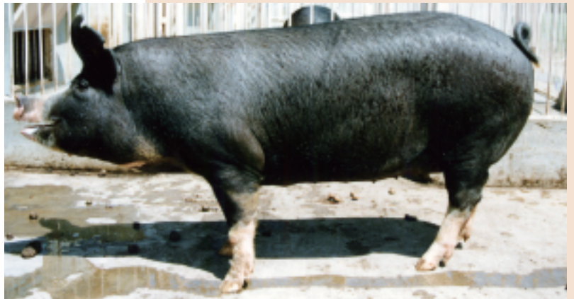
黒豚（バークシャー）

🐷 黒豚のように、効率を求めない豚の肥育方法もあり、ハンプシャーや中ヨークシャーの純粋に近いものも生産・販売されています。