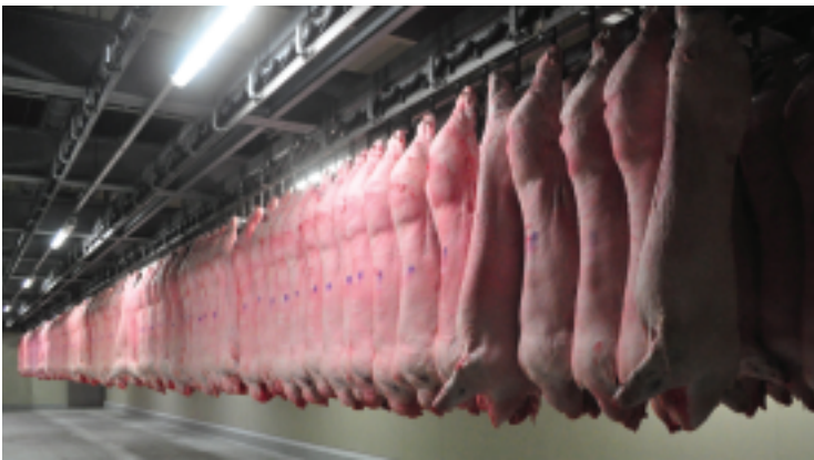
食肉センターでは2℃で1日冷蔵室で保管された後、カットされる

例えば、2℃で保管した場合、牛で10～15日、豚で4～6日、鶏で1日程度を要します。保管中に冷凍状態になると、熟成作用は停止するかゆるやかな状態になります。また5℃以上になると、熟成は早く進みますが、同時に食肉そのものの変質が起こります。