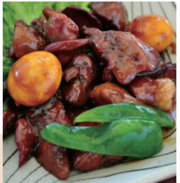
B級グルメで話題になった「甲府鳥もつ煮」は鶏のレバー、ハツ、砂肝、きんかん、ひもなどの副生物を使っている

●一方、「モツ」は臓物（ぞうもつ）を略した呼び方で、基本的に「ホルモン」と同じものと言えます。