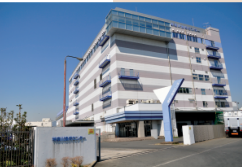
神奈川食肉センター