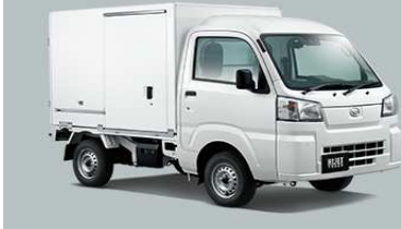
両側スライドドア仕様